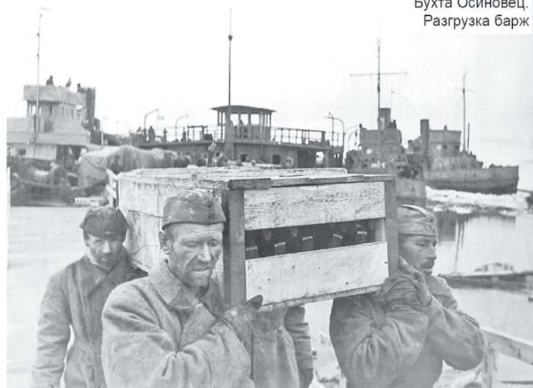
Бухта Осиновец. Разгрузка барж

Озёрные буксиры пароходства и канонерские лодки флотилии, выделенные для буксировки барж, были разделены на пять групп. В каждую группу входили один буксир, одна канонерская лодка, две-три баржи (всего тогда на перевозке грузов в Ленинград работали 22 сухогрузные баржи, в том числе девять озёрных, и четыре наливные, из них одна – озёрная). Проводку их по Ладоге должны были осуществлять буксиры «Морской лев», «Орёл», «Буй», «Никулясы» и канлодки «Селемжа», «Буря», «Бира», «Шексна», «Нора». Этим же приказом определялись время оборота барж и персональная ответственность работников пароходства за своевременное осуществление рейсов. Вводились подекадные планирование перевозок, вру-